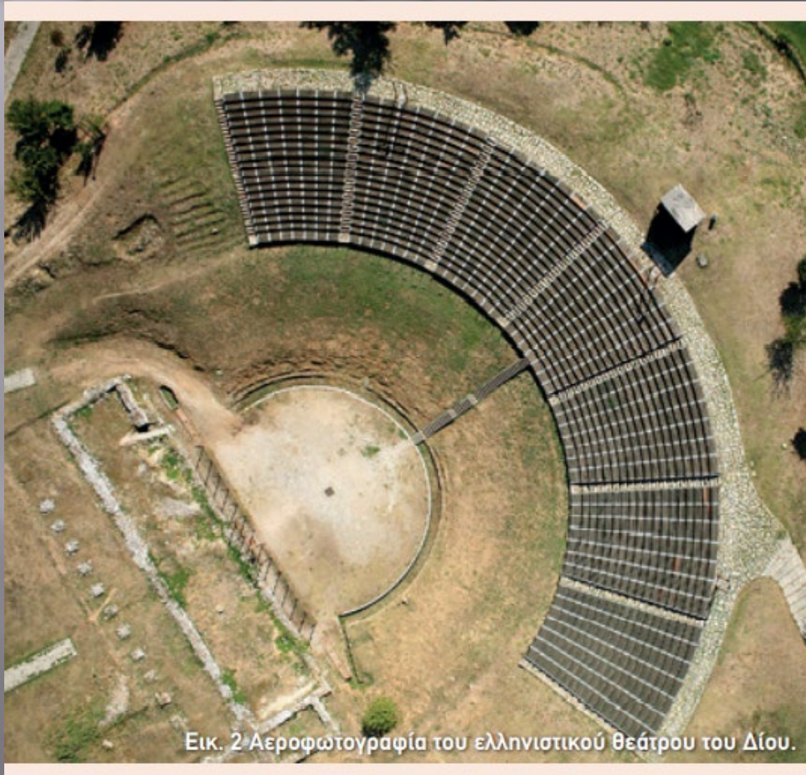
Εικ. 2 Αεροφωτογραφία του ελληνιστικού θεάτρου του Δίου.