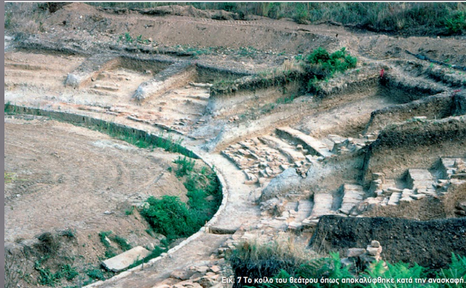
Εικ. 7 Το κοίλο του θεάτρου όπως αποκαλύφθηκε κατά την ανασκαφή.